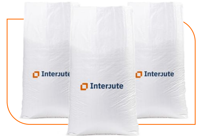
Saco de rafia