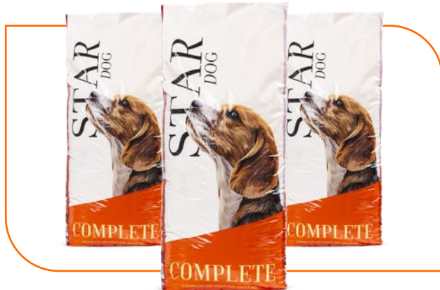
Sacos de rafia BOPP