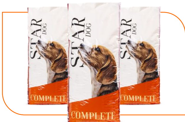
Sacos de Ráfia BOPP