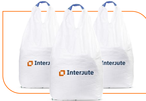
Big-Bag 1 asa